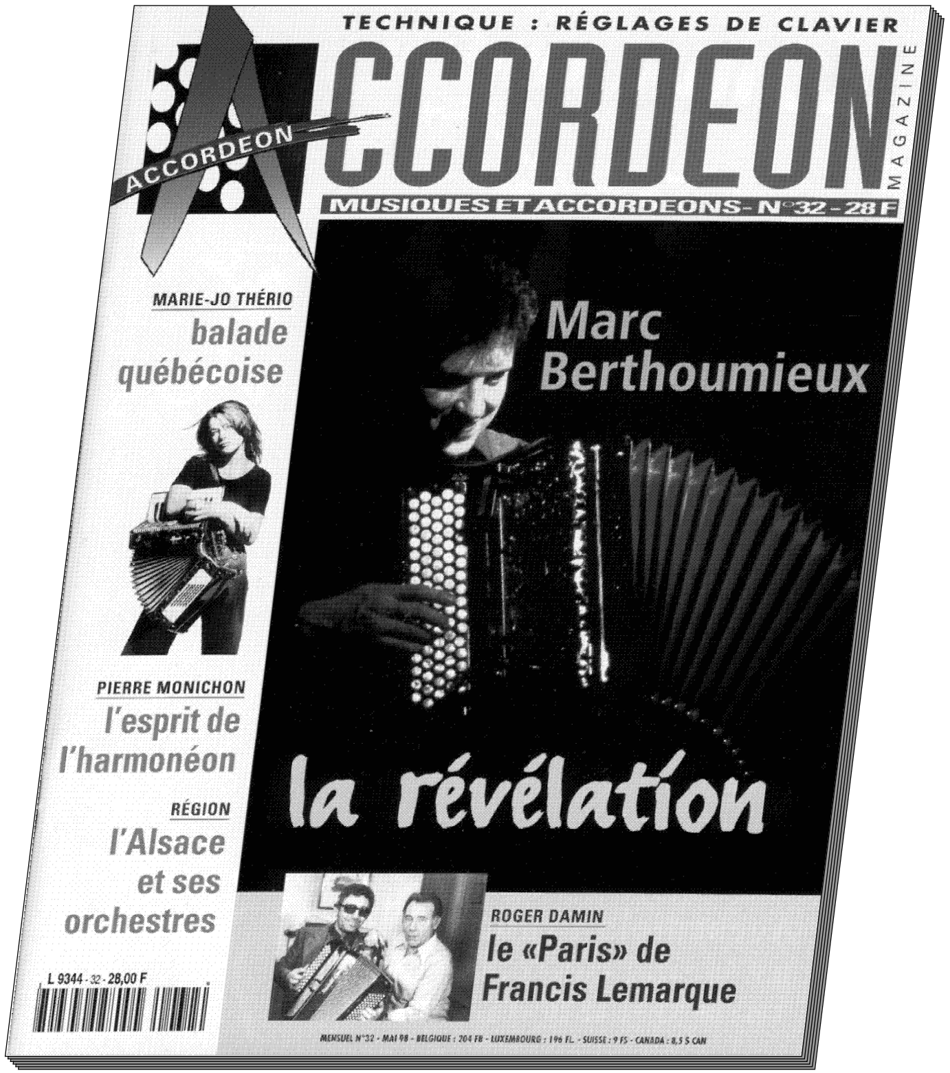
Couverture d'Accordeon Magazine et article de quatre pages – Mai 98 (Tirage 14500 ex.)