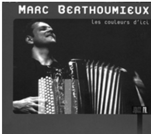
« Les couleurs d'ici », de Marc Berthoumieux, est en vente chez tous les bons magasins de disques.

C'est pourquoi « mon but est de proposer une autre façon d'entendre l'accordéon. L'instrument devient soliste et expose les thèmes ». Les compositions laissent une grande place à l'improvisation. Mais aussi à la technique. Comme par exemple de « superposer d'autres sons à la sonorité naturelle de l'instrument, d'obtenir de nouvelles couleurs afin de redonner une image et un autre souffle à l'accordéon ». Le résultat donne un album très justement baptisé « Les couleurs d'ici ». Une musique rythmée, voire syncopée, dont les accents ne vont pas sans rappeler le Brésil.